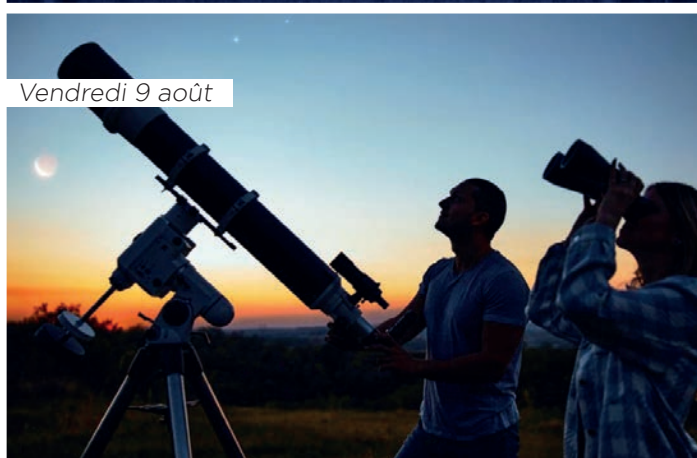
Vendredi 9 août