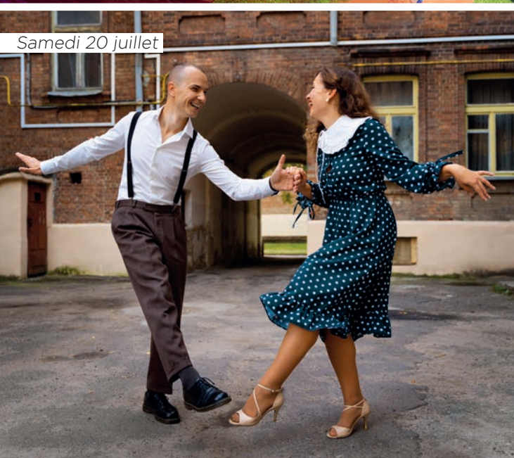
Samedi 20 juillet