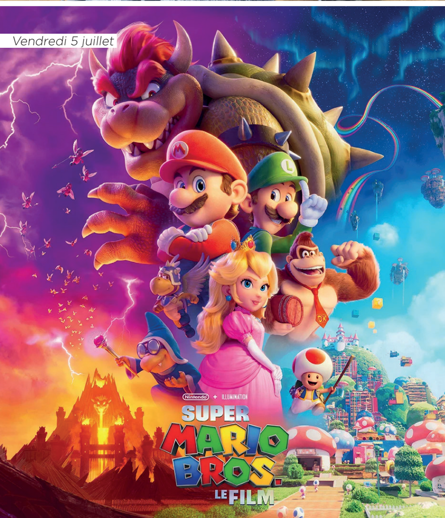
Vendredi 5 juillet