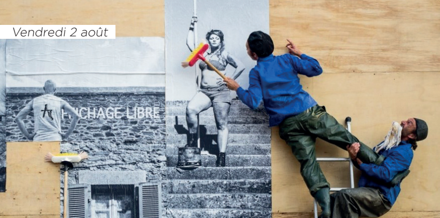
Vendredi 2 août