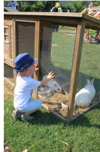
Sortie à la Ferme de Mézidon Canon