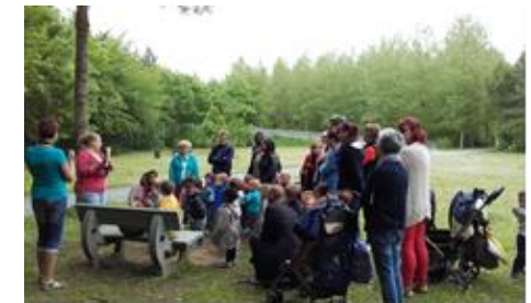
Ballade contée Crèche-RAM