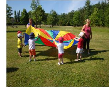
Les « Olympiades »